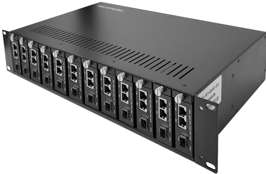
429 x 230 x 90 mm

전용 집합형 샤시를 사용하면 센터에서 여러 대의 미디어 컨버터를 집중화하여 효율적으로 운용할 수 있습니다. 최대 14개의 DIVA-ME 시리즈를 집합형 샤시에 장착할 수 있으며 AC 전원을 이중으로 연결하여 안정성을 향상시킵니다. 전용 집합형 샤시는 2U 사이즈로 19인치 랙 장착 구조를 제공합니다.