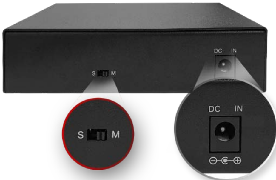
DEEP Switch (송신기 / 수신기 전환)